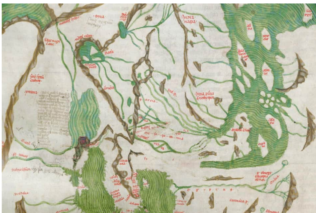
□Extrait de la mappemonde de Pietro Vesconte□

opposition idéologique entre un bloc d'États fondé sur le libéralisme et la libre entreprise et un autre fondé sur le régime « communiste » et la propriété étatique de l'économie. Ce dernier bloc a été remplacé, dans la nouvelle période, par une alliance de convenance entre un État chinois toujours dirigé par un parti « communiste », bien que le pays soit profondément intégré au marché capitaliste mondial et que le secteur privé contribue à plus de 60 % de son PIB, et un État russe dont le dirigeant est considéré comme un modèle par l'extrême droite mondiale et dans lequel les frontières entre les secteurs privé et étatique sont aussi poreuses que dans d'autres États rentiers népotistes.